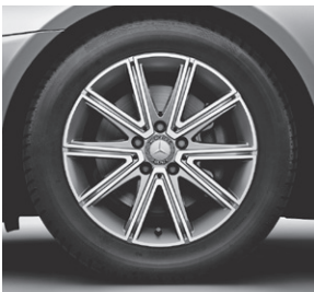
43,2 cm (17") Leichtmetallrad im 10-Speichen-Design (R93)