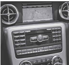
COMAND Online (427)