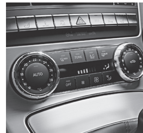
Klimaanlage THERMOTRONIC (581)