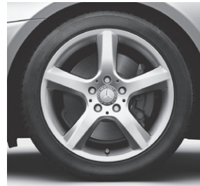
43,2 cm (17") Leichtmetallrad im 5-Speichen-Design (37R)