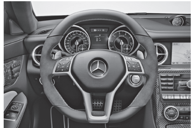
AMG Performance Lenkrad in Leder Nappa schwarz/Alcantara® (281), AMG Zierelemente Carbon (H73)