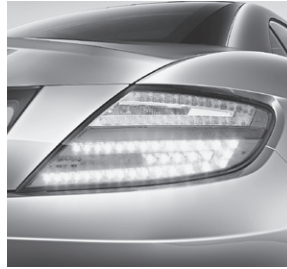
Heckleuchten in LED-Technik