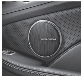
Harman Kardon® Logic7® Surround-Soundsystem (810)