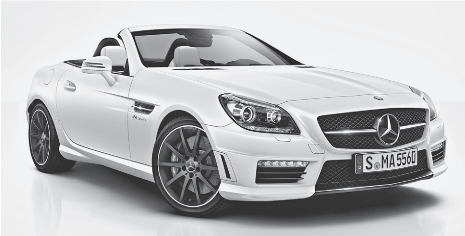
designo Lack magno kaschmirweiß (049), 45,7 cm (18") AMG Leichtmetallräder im 10-Speichen-Design mattschwarz lackiert (760)