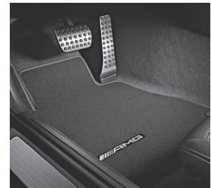
AMG Fußmatten (U26)