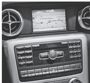
Becker® MAP PILOT für Audio 20 CD (509)