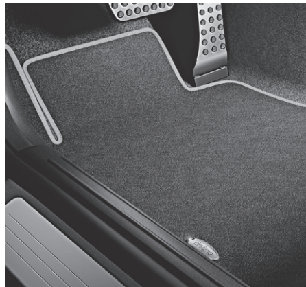
designo Fußmatten Velours schwarz mit Ledereinfassung in platinweiß pearl