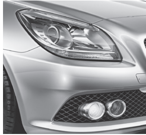
Klarglas-Scheinwerfer; Tagfahrlicht und Nebelscheinwerfer (257)