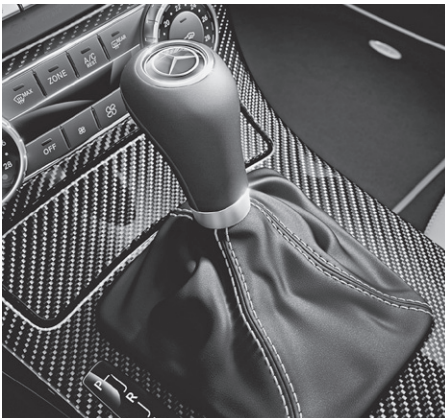
Wählhebel inklusive Schaltbalg in Leder Nappa mit Kontrastziernähten in platinweiß