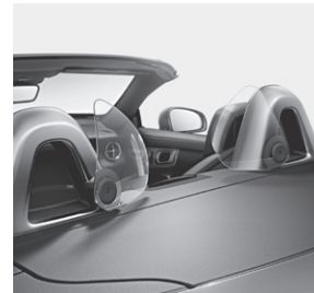
AIRGUIDE und Überrollbügel mit Einleger Aluminium eloxiert (283+B15)