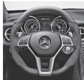
AMG Performance Lenkrad in Leder Nappa schwarz/Alcantara® (281)