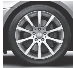
43,2 cm (17") Leichtmetallrad im 10-Speichen-Design (R35) (Serie SLK 350)