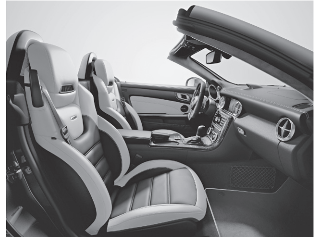
designo Leder Exklusiv zweifarbig platinweiß pearl/schwarz (X88)