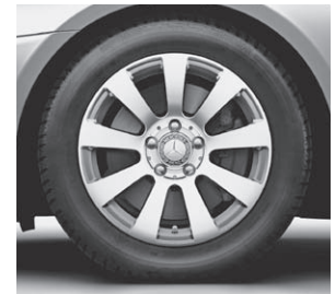
40,6 cm (16") Leichtmetallrad im 9-Speichen-Design (R12)