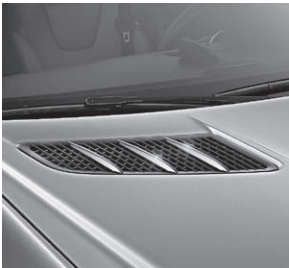
Finnenaufsätze für die Motorhaube