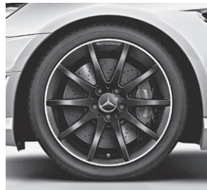
45,7 cm (18") AMG Leichtmetallrad im Vielspeichen-Design, Mattschwarz lackiert (760)