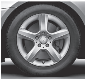
40,6 cm (16") Leichtmetallrad im 5-Speichen-Design (R19)