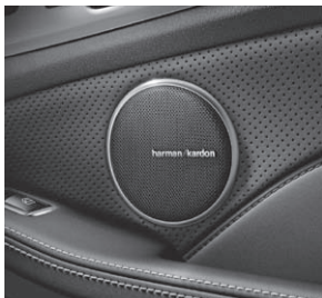
Harman Kardon® Logic7® Surround-Soundsystem