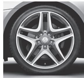
45,7 cm (18") Leichtmetallrad im 5-Doppelspeichen-Design (22R)