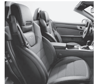
AMG Sportsitze mit Ledernachbildung ARTICO/Stoff