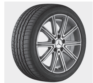
10-Speichen-Design, Palladiumsilber, glanzgedreht