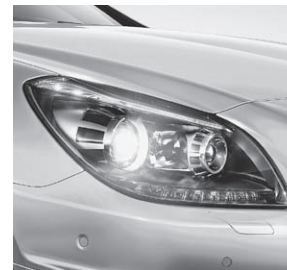
Scheinwerfer mit dunkler Einfassung