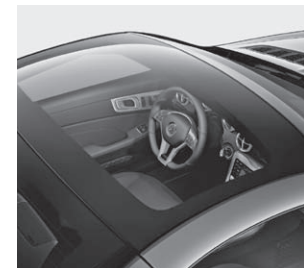
Panorama-Variodach mit MAGIC SKY CONTROL