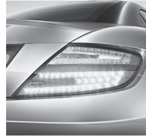
Heckleuchten in LED-Technik