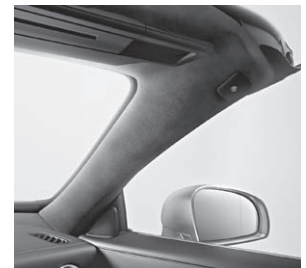
designo Scheibenrahmen Alcantara®