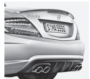
AMG Heckschürze, Abrisskante und Sport-Abgasanlage