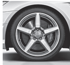
45,7 cm (18") AMG Leichtmetallrad im 5-Speichen-Design (790)