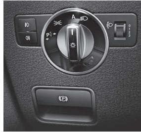
Feststellbremse elektrisch mit Komfortfunktion