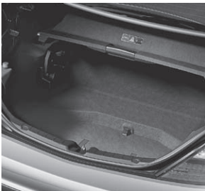
Kofferraum mit Wendeboden