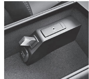
USB-Schnittstelle und AUX-IN- Anschluss in der Mittelkonsole