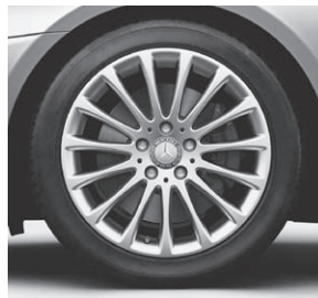
43,2 cm (17") Leichtmetallrad im Vielspeichen-Design (R81)