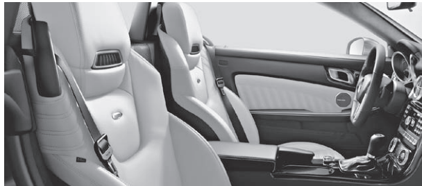
designo Leder Exklusiv einfarbig