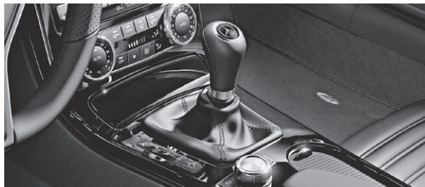
designo Zierelemente in Klavierlack schwarz