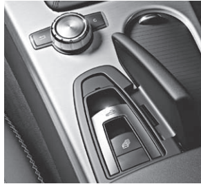
Dach-Bedieneinheit und zentrales Bedienelement