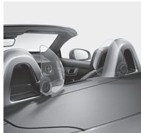
AIRGUIDE und Überrollbügel mit Einleger Aluminium eloxiert