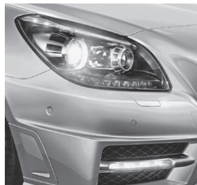
Intelligent Light System (Darstellung mit Sport-Paket AMG)