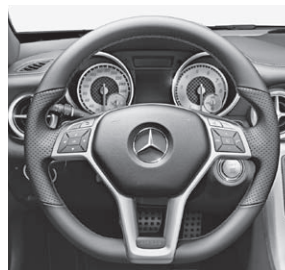
Multifunktions-Sportlenkrad mit Perforation und roter Ziernaht