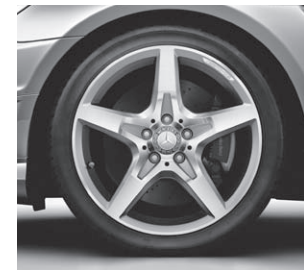
45,7 cm (18") AMG Leichtmetallrad im 5-Speichen-Design, glanzgedreht