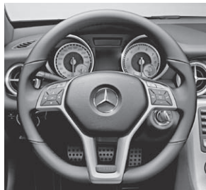
Multifunktionslenkrad im 3-Sp.-Design, unten abgeflacht