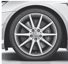
45,7 cm (18") AMG Leichtmetallrad im Vielspeichen-Design, Titangrau lackiert (796)