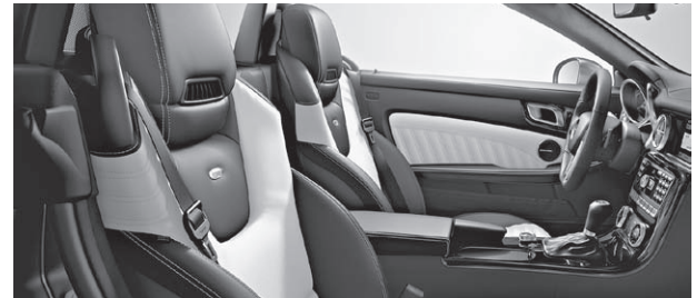
designo Leder Exklusiv zweifarbig