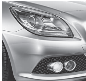
Klarglas-Scheinwerfer, Tagfahrlicht und Nebelscheinwerfer