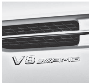
»V8 AMG« Schriftzug