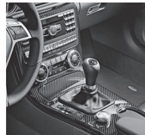
Zierelemente AMG Carbon