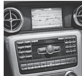
Becker® MAP PILOT für Audio 20 CD