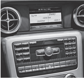
Audio 20 CD