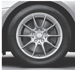
40,6 cm (16") Leichtmetallrad im 10-Speichen-Design (39R) (Serie SLK 200)