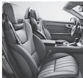
Sitze im spezifischen Längspfeifen-Design