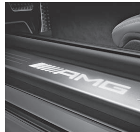
AMG Einstiegsschienen beleuchtet