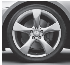
45,7 cm (18") Leichtmetallrad im 5-Speichen-Design (R32)